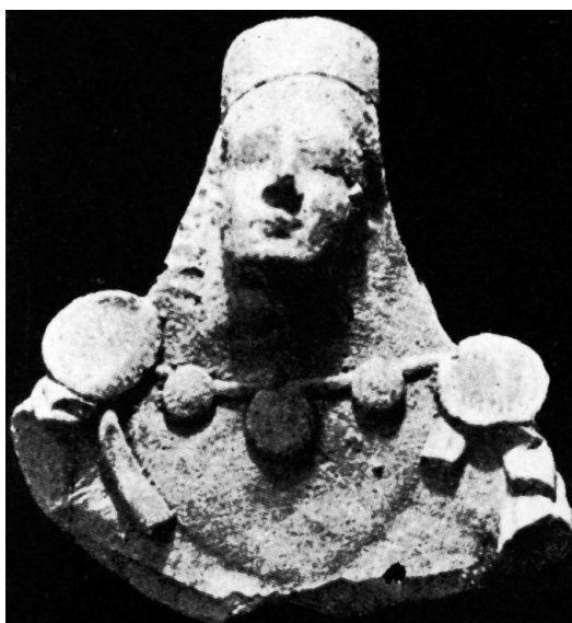
Fig. 11: GÀBRICI 1927, tav. XLIII, 7.