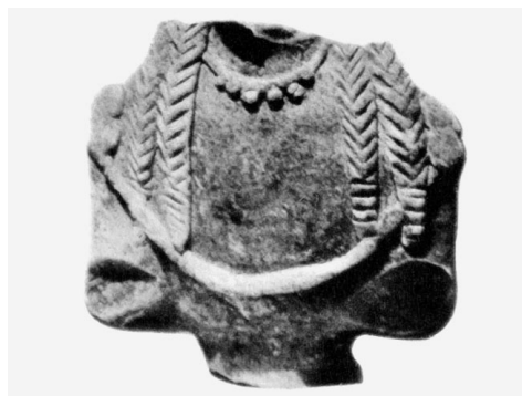
Fig. 13: GÀBRICI 1927, tav. XXXVII, 7.