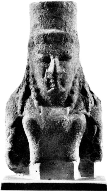
Fig. 6: FAEDO 1970, tav. II, 1.