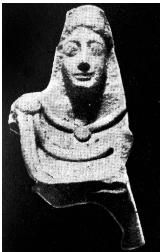
Fig. 10: GÀBRICI 1927, tav. XLIII, 1.