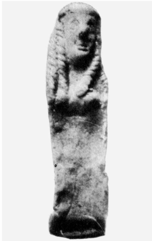
Fig. 9: GÀBRICI 1927, tav. XXXVII, 2.