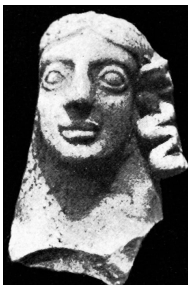
Fig. 12: GÀBRICI 1927, tav. XLIII, 2.