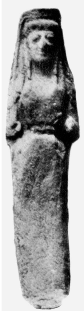
Fig. 3: GÀBRICI 1927, tav. XXXVII, 4.