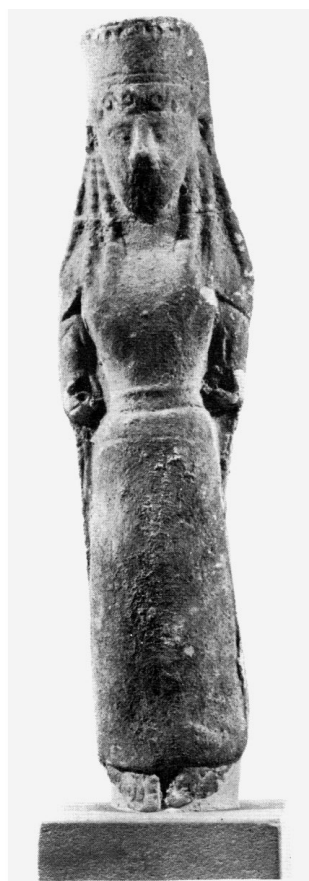
Fig. 2: FAEDO 1970, tav. I, 2.

Per quanto concerne la resa dei riccioli a spirale sulla fronte, un trattamento del tutto analogo alla statuetta di fig. 2 si riscontra in un'altra testina pubblicata da Gàbrici 51 (fig. 4), che presenta anche una resa decorativa, a piccole perle, delle ciocche ai lati del collo. Il confronto con un sigillo laconico a testa femminile del 640-630 a.C. 52 , non dissimile nella resa dei tratti del volto, con tratti aguzzi e mento quadrato, può suggerire per la testina un richiamo all'ambito laconico. Nello stesso clima stilistico, anche se con un trattamento molto più accurato, si può collocare la figura posta su un'arula fittile frammentaria sempre proveniente dal santuario della Malophoros 53 . La stretta somiglianza tra la resa facciale dei due pezzi rende verosimile l'ipotesi che siano entrambi tratti dalla stessa matrice.