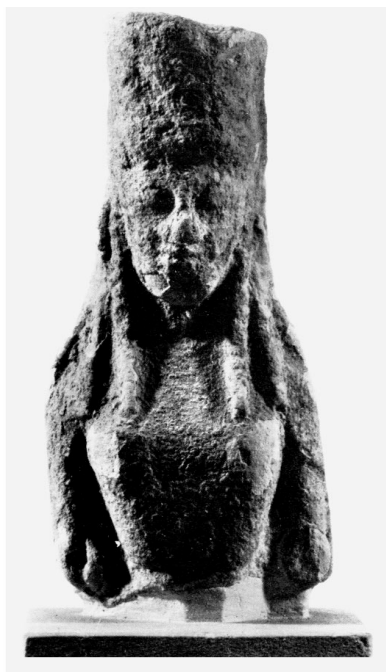
Fig. 1: FAEDO 1970, tav. I, 1.