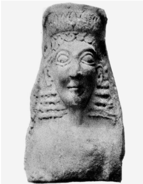
Fig. 8: GÀBRICI 1927, tav. XXXVII, 3.