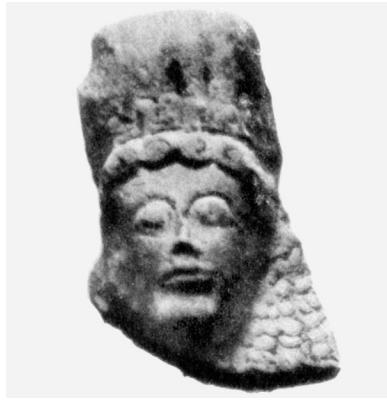
Fig. 4: GÀBRICI 1927, tav. XXXVII, 6.